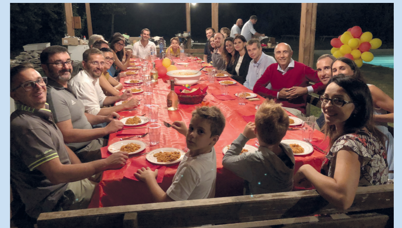
Mediterranea's Staff and their families. (September 2018)